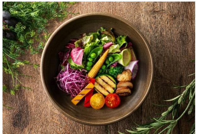
BAY GRILL サラダ

「BAY GRILL サラダ」は、新鮮な野菜をそのまま味わう“フレッシュ”から、香ばしさを引き立てる“グリル”、食感を楽しむ“ソテー”、軽やかな“フライ”、そして優しく蒸し上がる“スチーム”までひと皿の中で多彩な調理法を組み合わせることで、素材の持つ個性と旨味を最大限に引き出した特別な一品です。神奈川県産の食材をふんだんに使用し、その時期でしか味わえない一皿でお出迎えします。